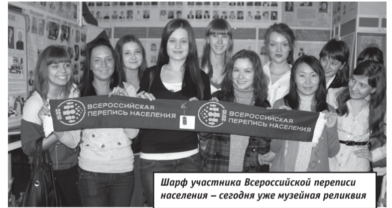
Шарф участника Всероссийской переписи населения – сегодня уже музейная реликвия