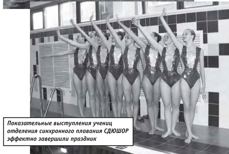
Показательные выступления учениц отделения синхронного плавания СДЮШОР эффектно завершили праздник