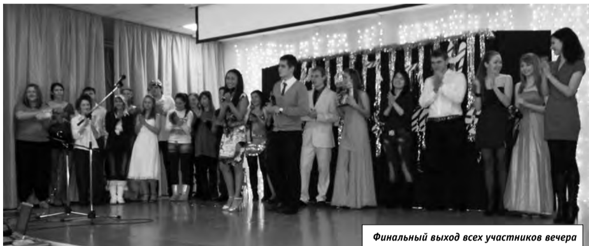
Финальный выход всех участников вечера

Хочется сердечно поблагодарить всех студентов, принявших активное участие как в самом рождественском вечере, так и в его подготовке. Ведь благодаря их творчеству мы обретаем очень ценное богатство – сокровища души, капитал, который будет с нами всегда!