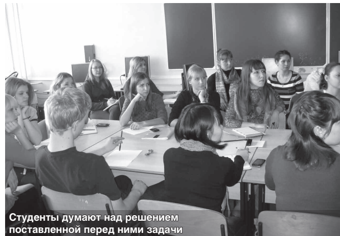
Студенты думают над решением поставленной перед ними задачи

Кейс-клуб НГУЭУ работает в университете уже третий год. Здесь студенты могут найти применение своим теоретическим знаниям. Клуб готовит будущих профессионалов, ведь его участники имеют возможность посетить мастер-классы, турниры, городские и региональные межвузовские кейс-чемпионаты с привлечением представителей регионального бизнеса и экспертов.