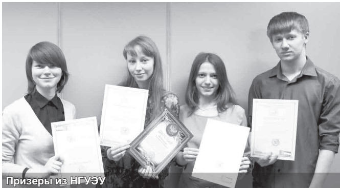
Призеры из НГУЭУ

Студенты нашего университета заняли призовые места на Городской олимпиаде по русскому языку и культуре речи для студентов-нефилологов. Очередное интеллектуальное соревнование среди вузов Новосибирска состоялось во вторник 23 апреля.