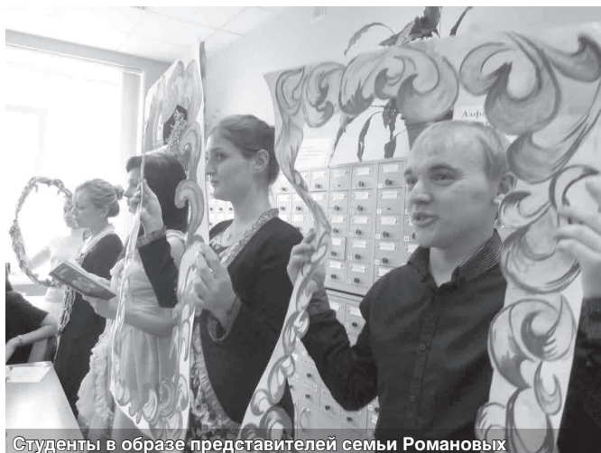
Студенты в образе представителей семьи Романовых

«Драгоценная моя женушка, горячо благодарю тебя за твое милое письмо (второе), полученное нынче после обеда, — пишет Николай II. — Я приехал ровно в 12 ч. 30 м. Н. встретил меня на большой станции за лесом. Вид у него здоровый и спокойный, хотя он пережил ужасные моменты, вернее, дни, когда германцы забирались все глубже и глубже... Со мной обедали четыре иностранных генерала. Вечером я с ними побеседовал. Они немало поездили по местам, где сейчас так сильно дерутся... Мое возлюбленное солнышко, я люблю тебя