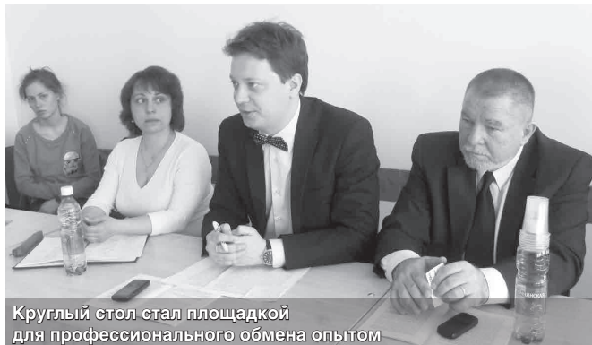
Круглый стол стал площадкой для профессионального обмена опытом

Круглый стол «Инновационный климат и кадровые технологии: взаимодействие бизнеса, образования и науки» состоялся в НГУЭУ в рамках VI Сибирского кадрового форума 26 апреля.