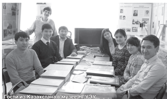
Гости из Казахстана в музее НГУЭУ

Магистранты Карагандинского экономического университета Казпотребсоюза приехали в НГУЭУ на международную недельную стажировку.