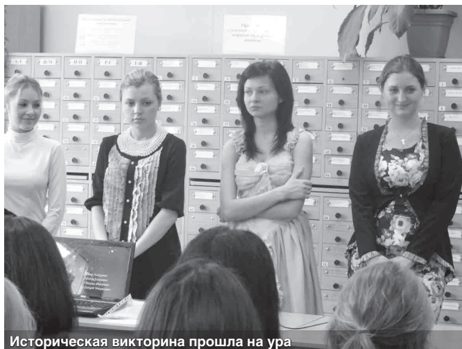
Историческая викторина прошла на ура

Студенты специальности «Реклама» сдали зачет по дисциплине «Выставочно-ярмарочная деятельность» в необычной форме: подготовили выставку книг, сделали своими руками бумажные цветы и прочли любовные письма Николая II.