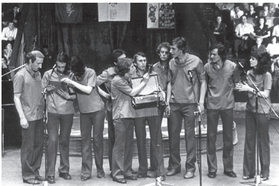
В от они, члены команды-победительницы телевизионного конкурса «От сессии до сессии», прославившие НИИХ на всю страну. Напомним, что этот конкурс вел Александр Масляков. 2002 год.